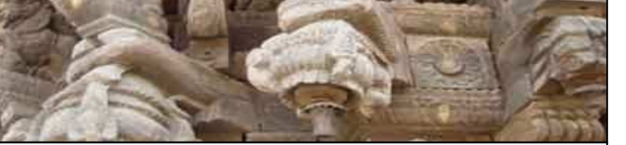
பழைய தேர் 119/1 நிலத்தில் நிற்கிறது: கலை வேலைப்பாடுகள் கொண்ட நூற்றாண்டுக் கால பழமை கொண்ட தேர்