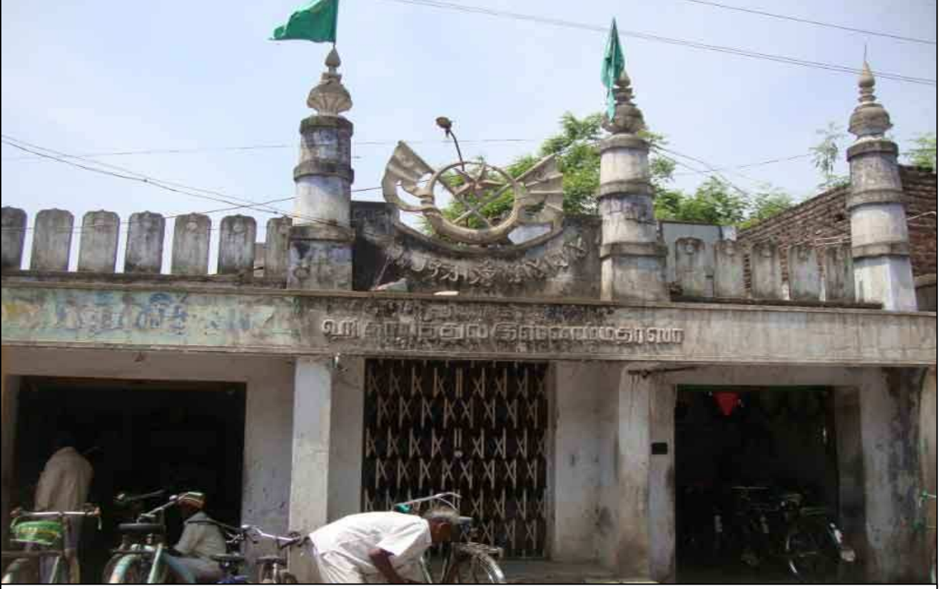
சிறிதே பழமையான மதராஸா : அருகிலேயே இந்துக்களும் வாழ்கின்றனர். சமய நல்லிணக்கத்தை காண முடிகிறது.